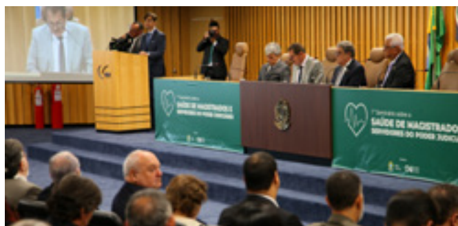
Seminário foi realizado no Tribunal Superior do Trabalho