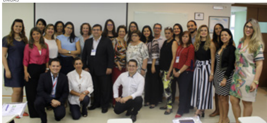
Capacitação em Ouvidorias foi promovida pela ABO e a Unidas em São Paulo

tões por eles colocadas, por meio de uma escuta atenta e imparcial, a fim de buscar soluções para eventuais problemas que possam ocorrer.